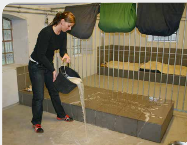
Varmerør kan placeres i en støbt kasse. På den måde får man et opvarmet og hævet liggeleje, mens gulvet stadig er køligt.