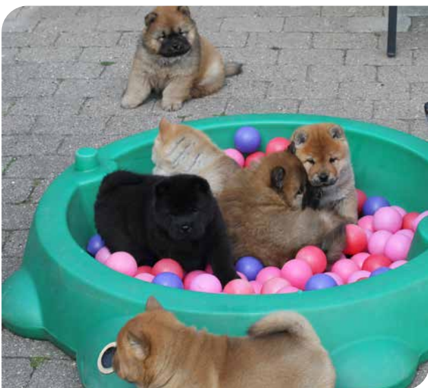
Hvalpe kan have stor glæde af at lege med ting, man finder på loppemarkeder eller i genbrugsbutikker (chow chow).