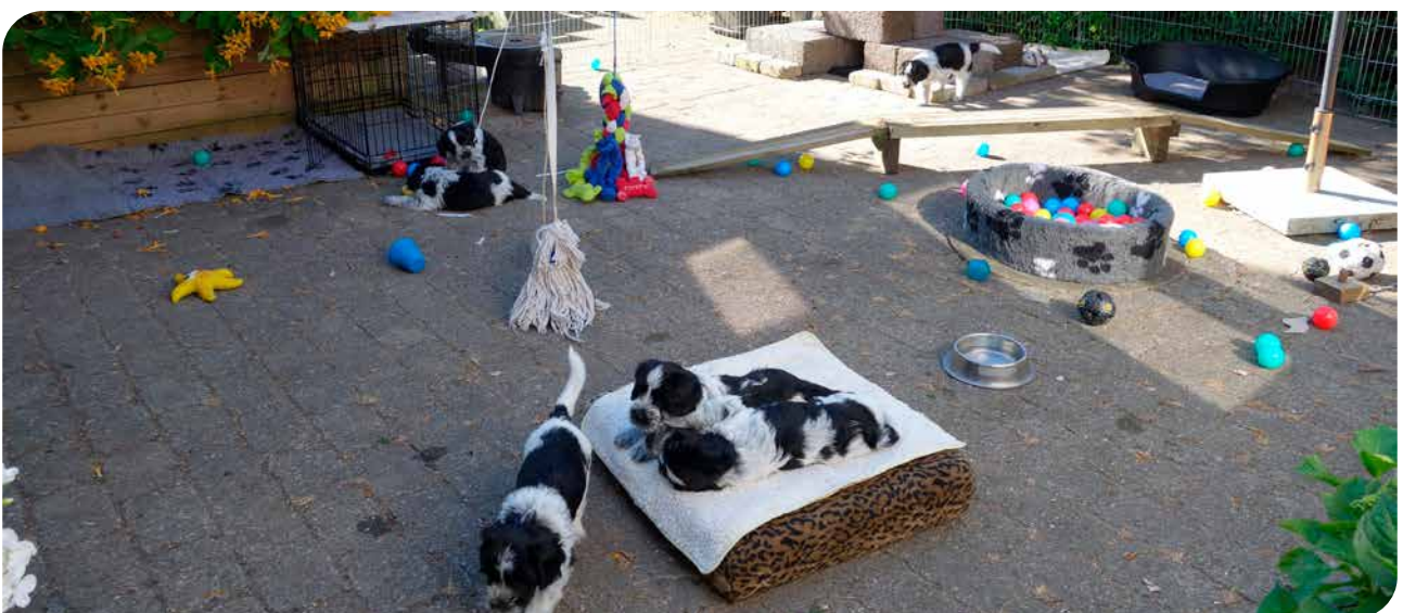
Hvalpe bliver bedre til at håndtere nye oplevelser som voksne, hvis de er vokset op i et stimulerende miljø. Man kan derfor med fordel bruge fantasien og indrette omgivelserne, så de stimulerer hvalpenes sanser (schapendoes).