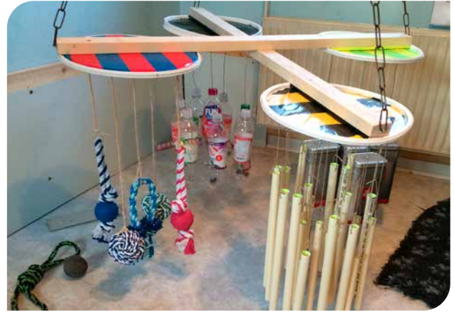
Her ses sjove, hjemmelavede miljøberigelsesredskaber. De er spændende for nysgerrige hundehvalpe at gå på opdagelse i.