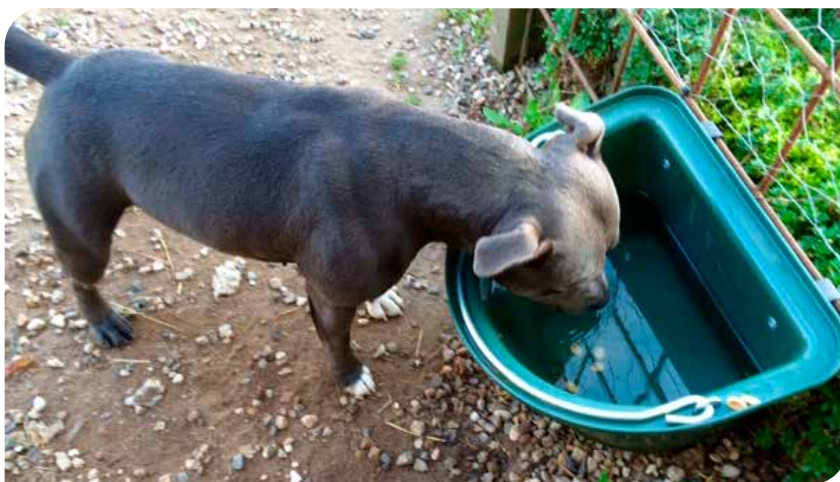
(Staffordshire bull terrier)

Nogle hunde, der keder sig, leger med vandskåle eller gnaver i spande. Da hunde altid skal have adgang til vand, handler det om at finde en holdbar løsning. Man kan sætte metalspande op eller anvende "kalvetrug". Man kan også grave et rør ned i jorden og placere spanden lidt lavere end rørets top.