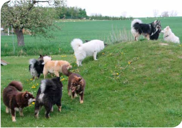
Hunde har stor glæde af områder, hvor de kan løbe og lege frit (finsk lapphund).