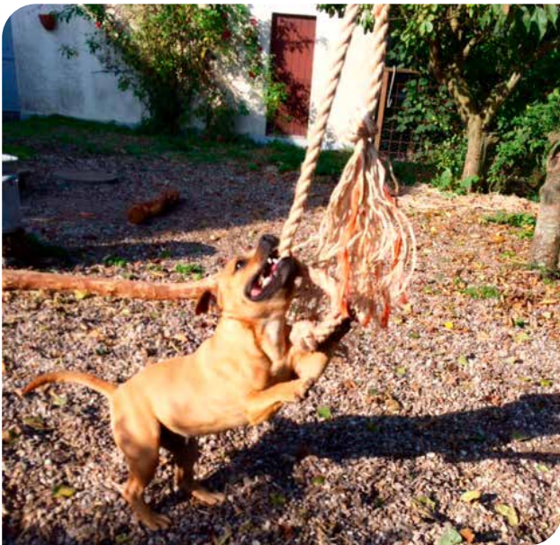
(Staffordshire bull terrier)

Der er heldigvis mange måder man kan gøre en hunds liv både spændende og afvekslende på. Se billederne nedenfor for inspiration.