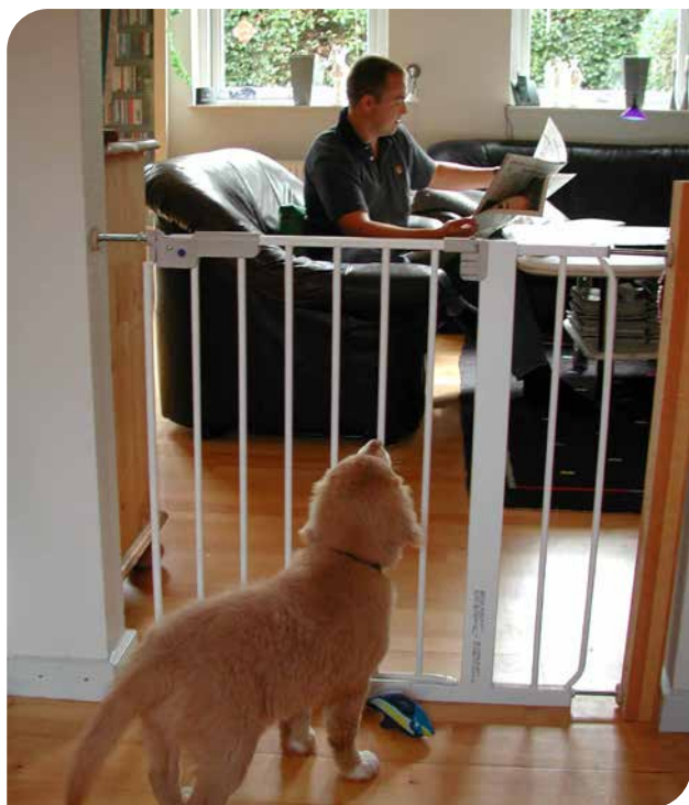
Et børnegitter kan adskille hund og ejer i perioder, hvor alene hjemme træning øves, eller hunde skal adskilles (nova scotia duck tolling retriever).

Hunde skal til enhver tid have adgang til frisk vand i rigelige mængder. Det er altså ikke nok at tilbyde hunde noget at drikke nogle gange om dagen, mens de er i deres bokse – de skal altid have adgang til vand.