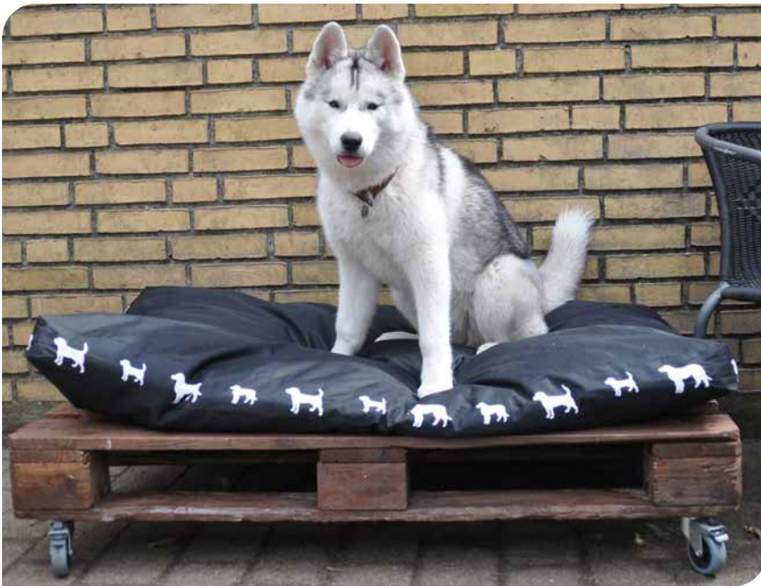
En palle monteret med hjul samt en madras, udgør en billig og praktisk hundeseng - både ude og inde (siberian husky).