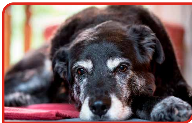
Hunde kan få særlige behov i takt med, at de bliver ældre. Gamle hunde kan blive lidt usikre, knytte sig mere til ejeren og trække sig fra flokken (ukendt race).