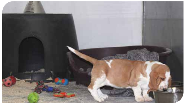
En murerbalje sat på hovedet, med et hul skåret i siden, kan være en billig, men fin hule til en mindre hunderace. En varmelampe kan placeres i et hul i toppen (bassethound).