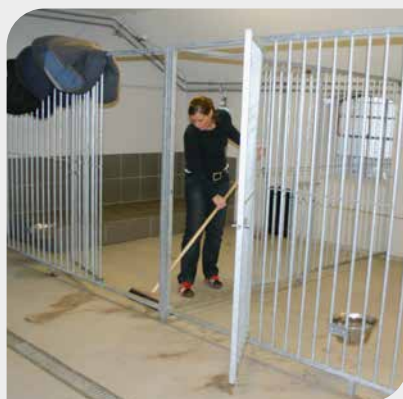
Urin og afføring skal fjernes dagligt og overflader vaskes efter behov.