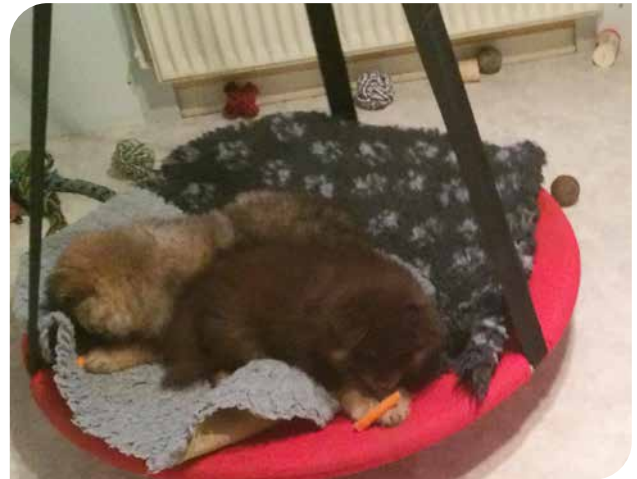
En baby-sansegyngende kan genbruges som legeredskab og seng for hundehvalpe (finsk lapphund).