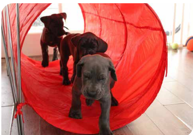
Hvalpe er meget nysgerrige fra de er 4-16 uger gamle. I denne periode er det ekstra vigtigt, at de har et spændende og stimulerende miljø at færdes i. De skal også have masser af kontakt med mennesker – velkendte såvel som fremmede.