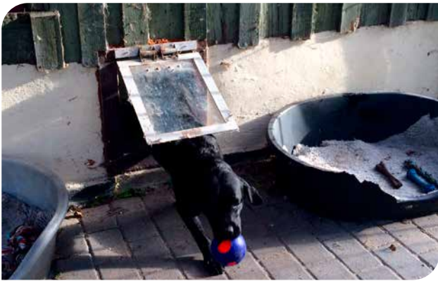
En hundelem (eller et vindfang) kan give hunden mulighed for selv at gå ind og ud til en hundegård (labrador retriever).