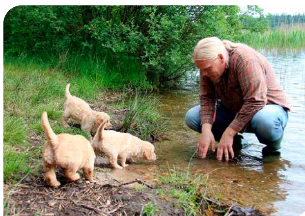
Når hvalpene bliver større, skal de med ud og opleve fremmede miljøer. Her er 8 uger gamle hvalpe med på deres første tur til en sø (golden retriever).