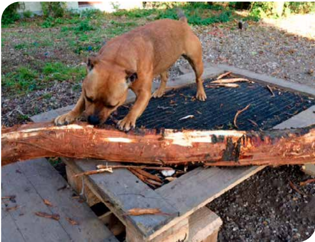
Store grene kan indgå som miljøberigelse (staffordshire bull terrier).