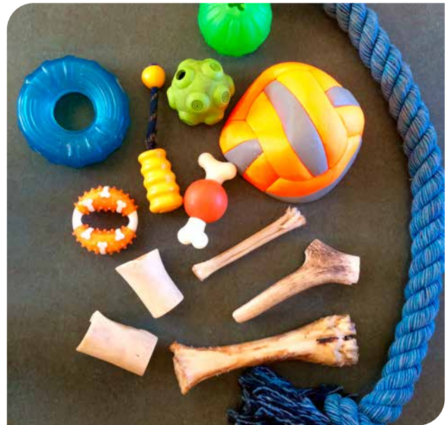
Der findes aktivitetsting / legetøj til alle typer og størrelser af hunde. Adgang til bl.a. "gnaveting" øger hundenes trivsel.