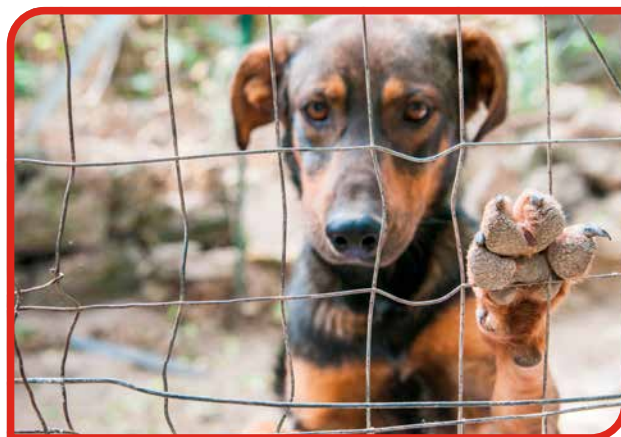
Kedsomhed og inaktivitet kan gøre hunden understimuleret og gøre, at den udvikler adfærdsproblemer (ukendt race).