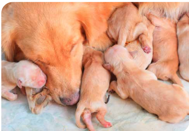
Hvalpene fødes døve og blinde og er afhængige af deres mor de første uger. I denne periode skal tæven have fred og ro (golden retriever).

det efterlades i lokalet. Hænderne vaskes og desinficeres grundigt. Det er også en god idé at opbevare