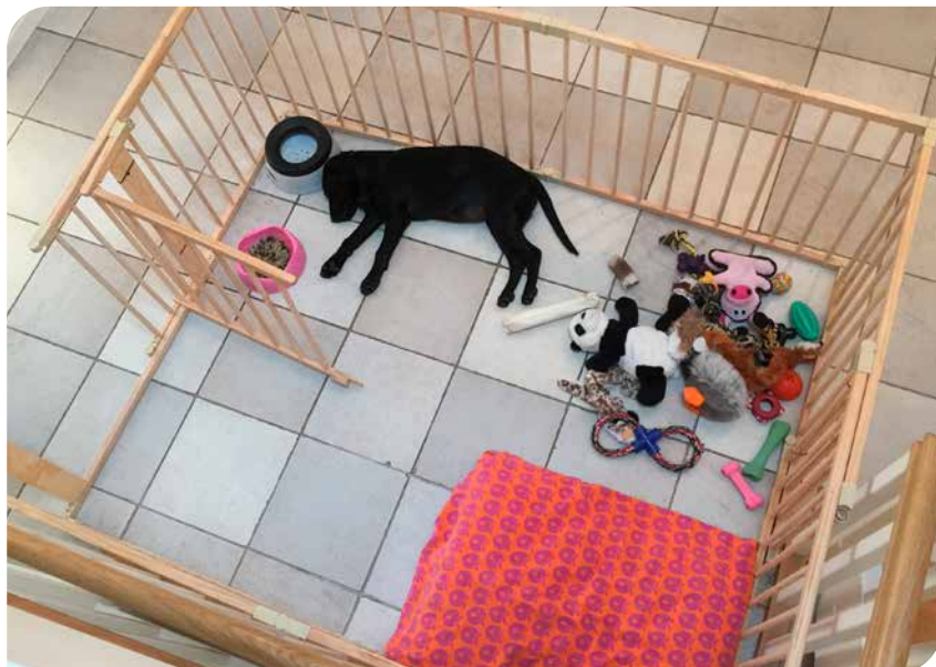
I stedet for et bur kan en stor hvalpegård sættes op, hvis en hund skal have ro eller holdes sikker i en periode (labrador retriever).

Et hundehold må ikke være baseret på, at hundene skal holdes i bur i flere timer dagligt. Hvis der er behov for at adskille hunde (ved løbetider, eller hvis der er konflikter mellem hundene), kan det eksempelvis gøres ved hjælp af "børnelåger", som giver hundene god plads, men opdeler huset i zoner.