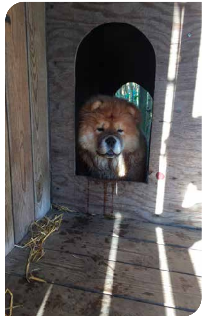
Fra vindfanget kan hunden sidde i læ og nyde udsigten (chow chow).