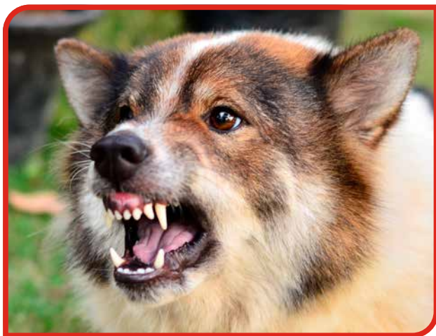
Hvis din hund udviser ængstelig eller aggressiv adfærd, kan det være tegn på, at den ikke trives, og så bør du søge hjælp til at få det løst (ukendt race).