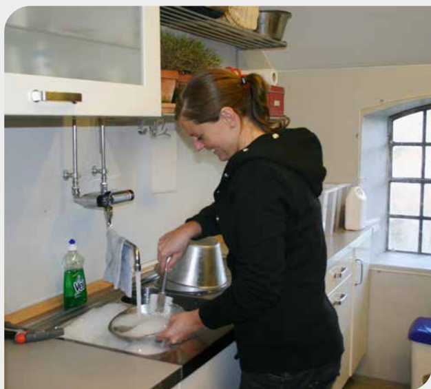
Hundeskåle bør vaskes i varmt vand og med sæbe dagligt.

Hvis du er i tvivl vedrørende desinfektion, f.eks. efter et sygdomsudbrud, så kontakt din dyrlæge.