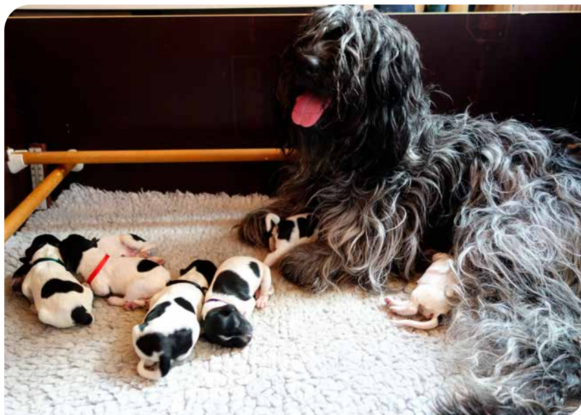
Fred og ro i hvalpekassen (schapendoes)