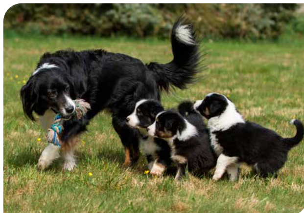
Hvalpe må tidligst tages fra deres mor, når de er fyldt 8 uger – det siger loven (border collie).