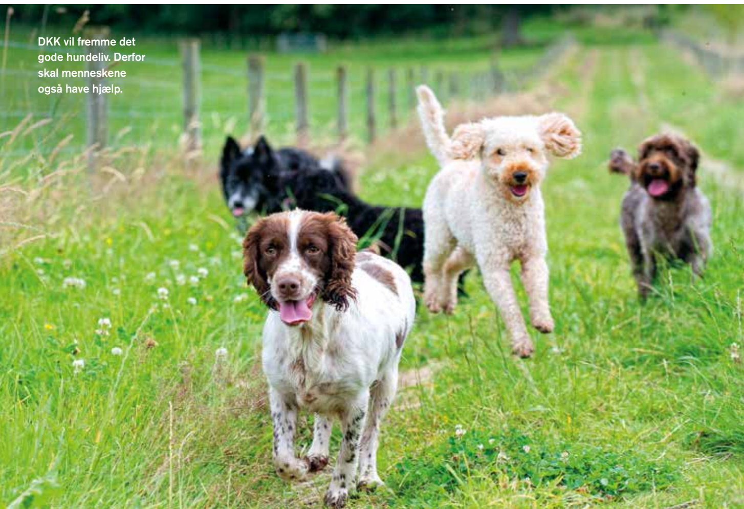
DKK vil fremme det gode hundeliv. Derfor skal menneskene også have hjælp.