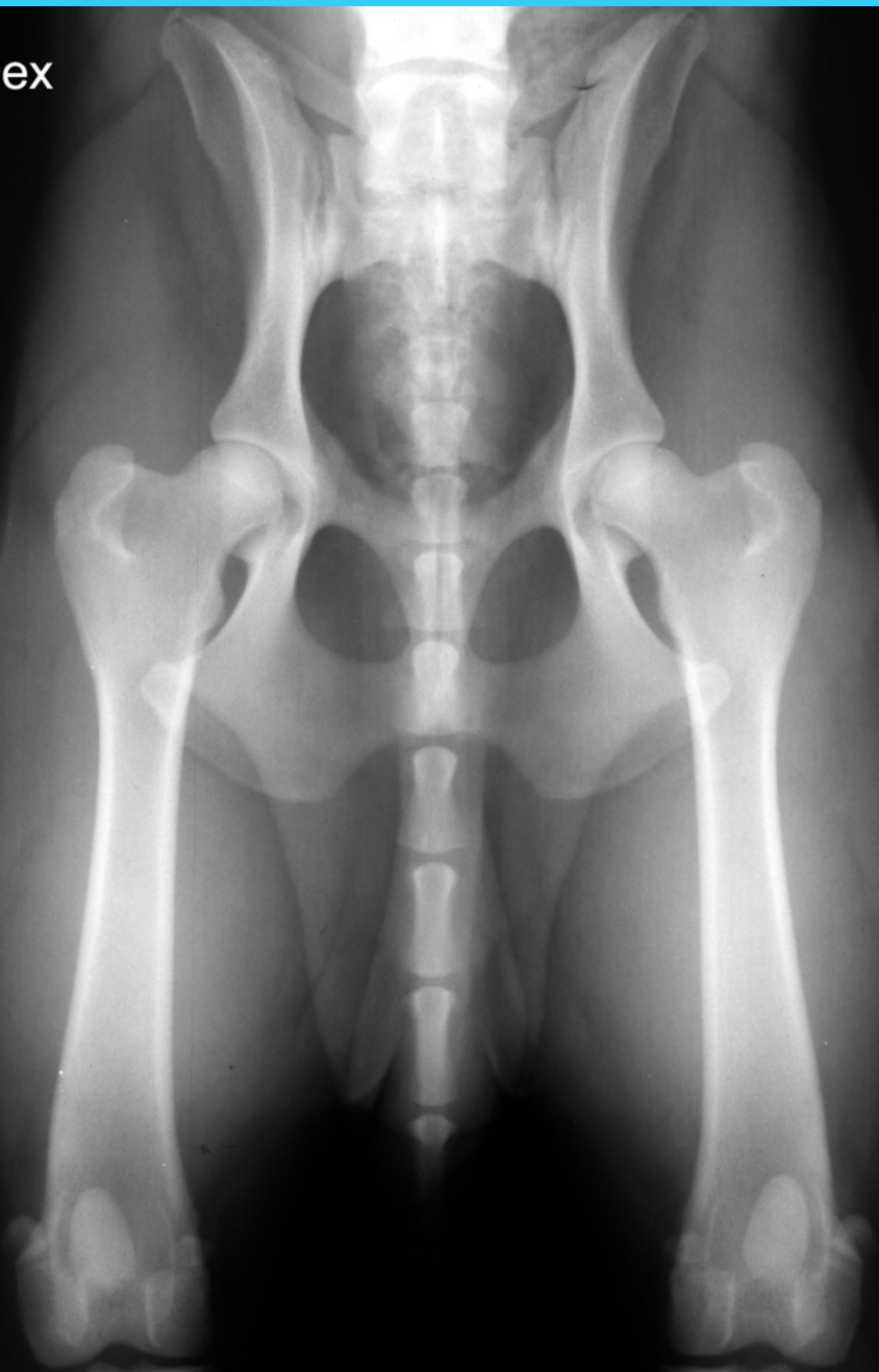
Labrador Retriever, M, 14 month