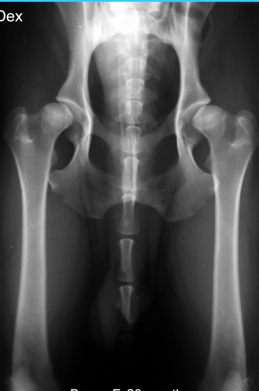
Boxer, F, 20 month