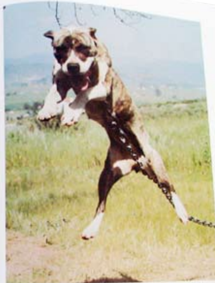
Luke's Charger, a daughter of Hummer, showing a typical attitude.